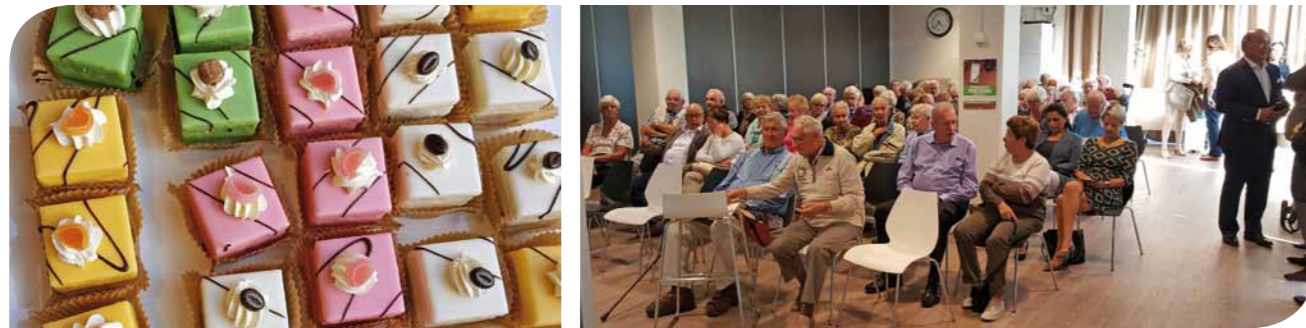
Drukke opkomst donateursdag 2016

Samen met een groot aantal collega's van het ziekenhuis hebben we een interessant programma in elkaar gezet met als doel om de donateurs een 'kijkje in de keuken' te geven van de al gerealiseerde projecten en om nader kennis te maken met de bestuursleden. Naast een presentatie door het bestuur over de manier van werken werden de bestuursleden kort voorgesteld. Alle vijf leden zetten zich vrijwillig in met als doel te zorgen voor de financiering van projecten die niet door de zorgverzekeraars worden vergoed, om zo de patiënten en bezoekers van het LangeLand Ziekenhuis nog beter te faciliteren.