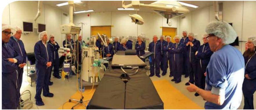
Leden van Floravontuur brachten een bezoek aan de operatiekamer